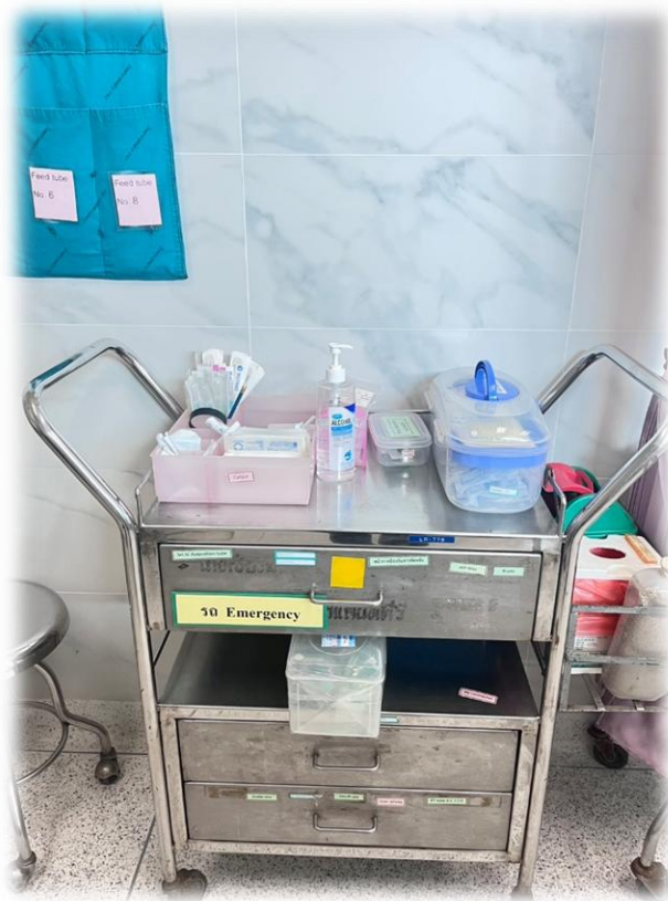
ชุดอุปกรณ์ ยาและเวชภัณฑ์ในการช่วยฟื้นคืนชีพ