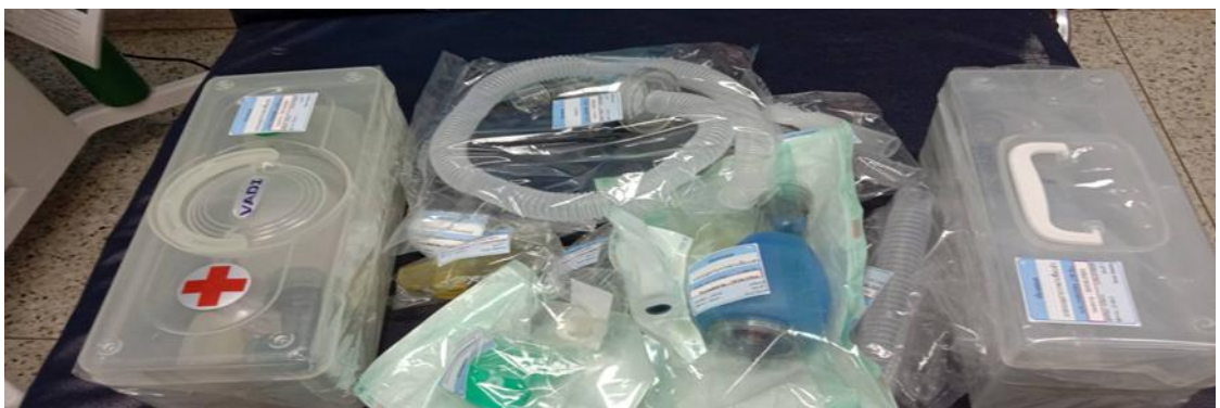
ระบบแก้สทางการแพทย์ เครื่องดูดเสมหะ และอุปกรณ์ช่วยหายใจ