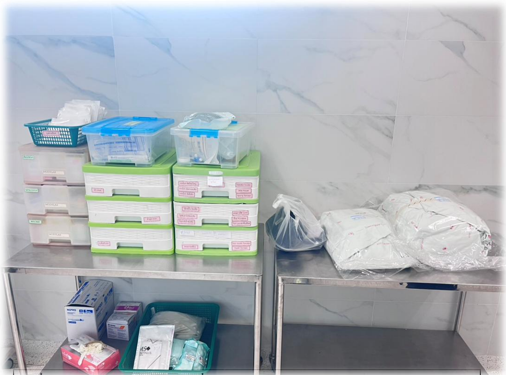
เครื่องมือทำคลอดจำนวนที่เพียงพอและได้มาตรฐานทางการแพทย์