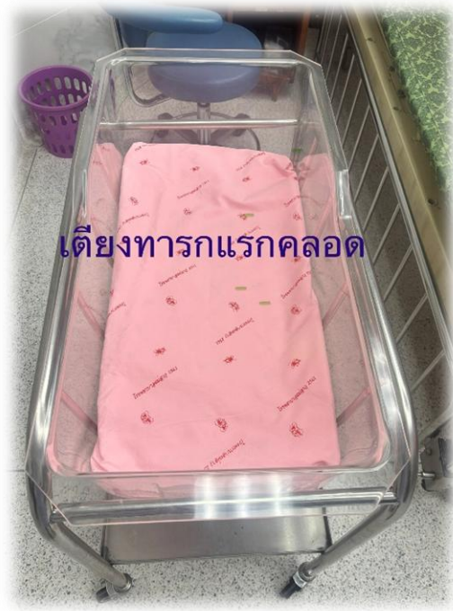
เตียงทารกแรกคลอด