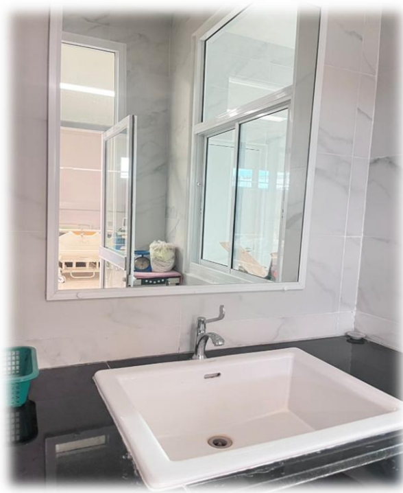
อ่างอาบน้ำทารก