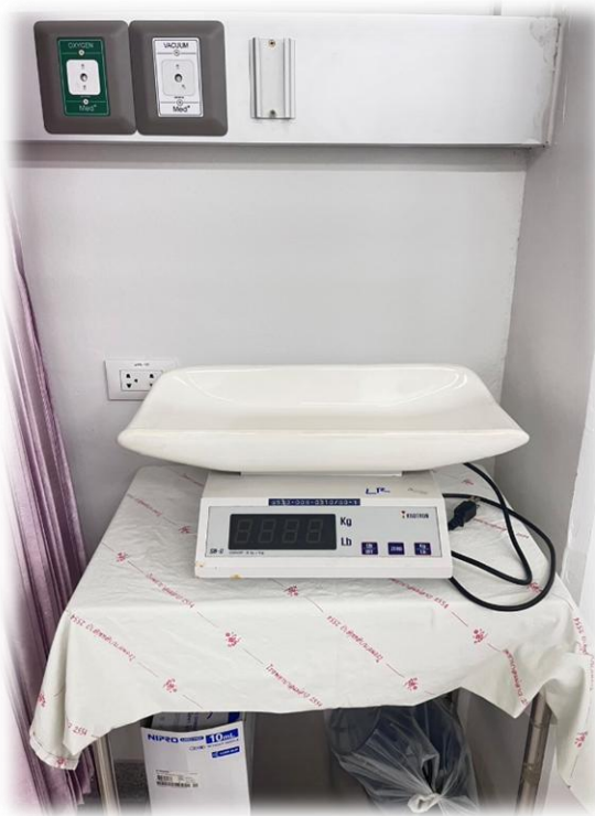
เครื่องชั่งน้ำหนักทารกแรกเกิด