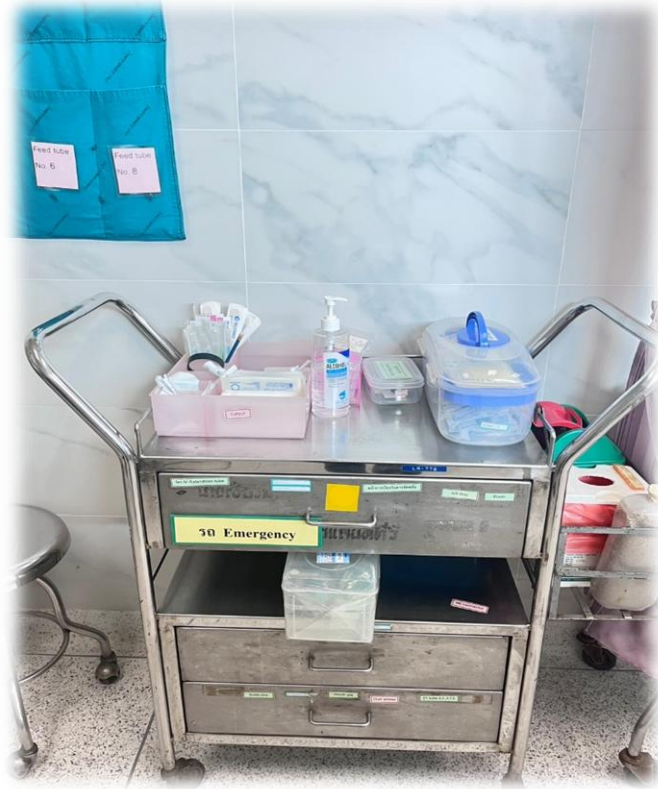
ชุดอุปกรณ์ ยาและเวชภัณฑ์ในการช่วยฟื้นคืนชีพ