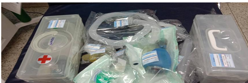
เครื่องดูดเสมหะ ออกซิเจนและอุปกรณ์ช่วยหายใจ