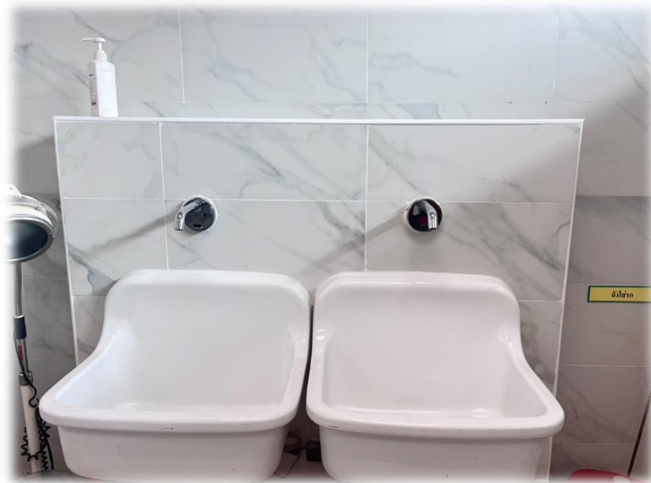
อ่างฟอกมือชนิดที่ไม่ใช้มือเปิดปิดน้ำ