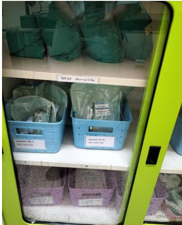
ชุดตรวจภายในและชุดชุดมดลูกที่ได้มาตรฐานทางการแพทย์