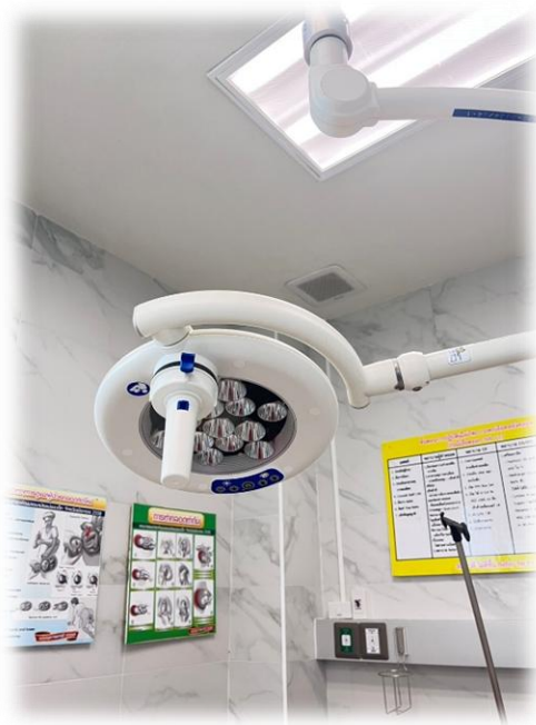
โคมไฟหรืออุปกรณ์แสงสว่างเพื่อการตรวจภายใน