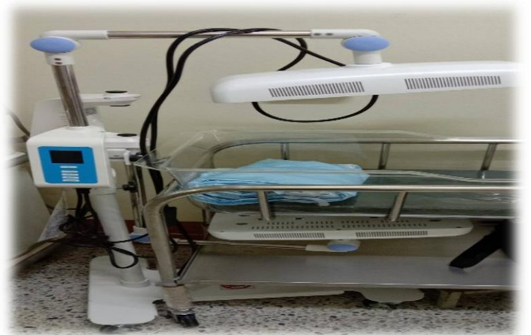
เครื่องรักษาทารกตัวเหลืองด้วยแสง