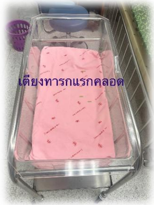
เตียงทารกหลังคลอด