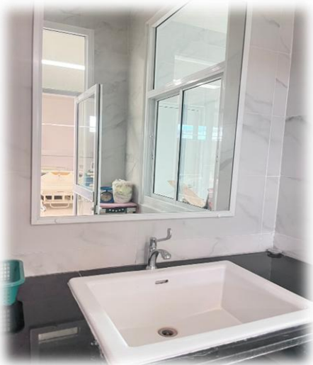
อ่างอาบน้ำทารก