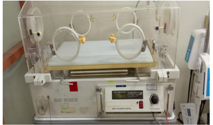
ตู้อบทารกคลอดก่อนกำหนด