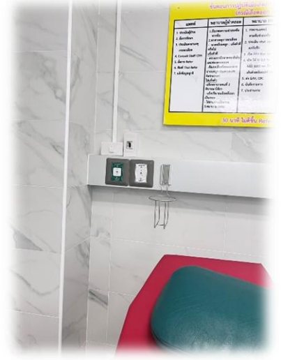
เครื่องดูดเสมหะ ออกซิเจนและอุปกรณ์ช่วยหายใจ