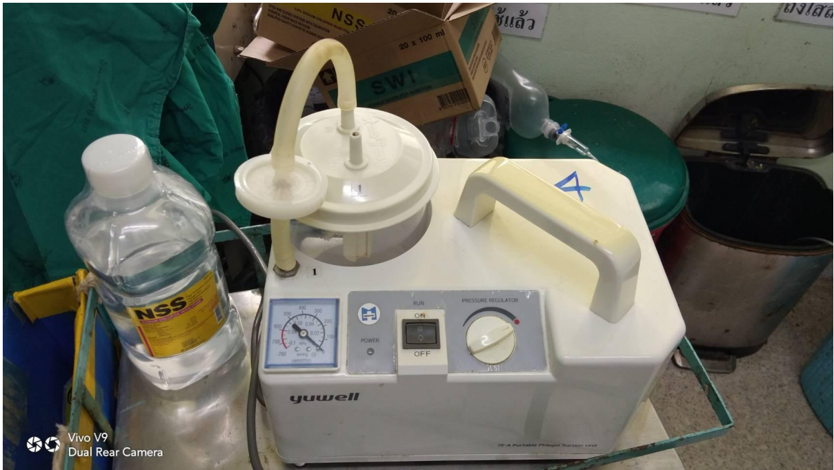
เครื่องดูดเสมหะ