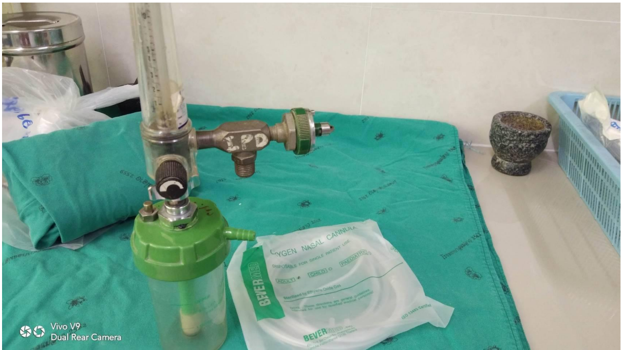
ออกซิเจนและอุปกรณ์ช่วยหายใจ