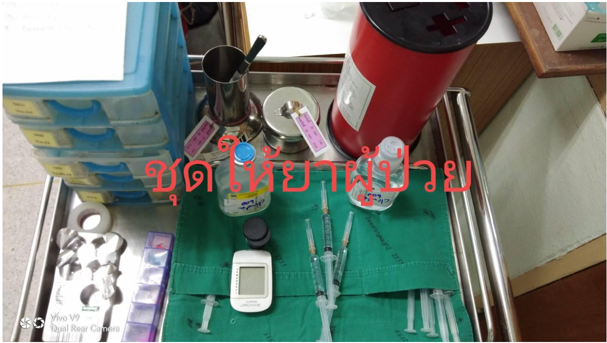
ชุดให้ยาผู้ป่วย