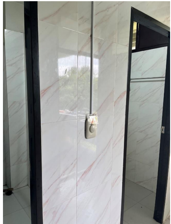
ระบบเรียกพยาบาล