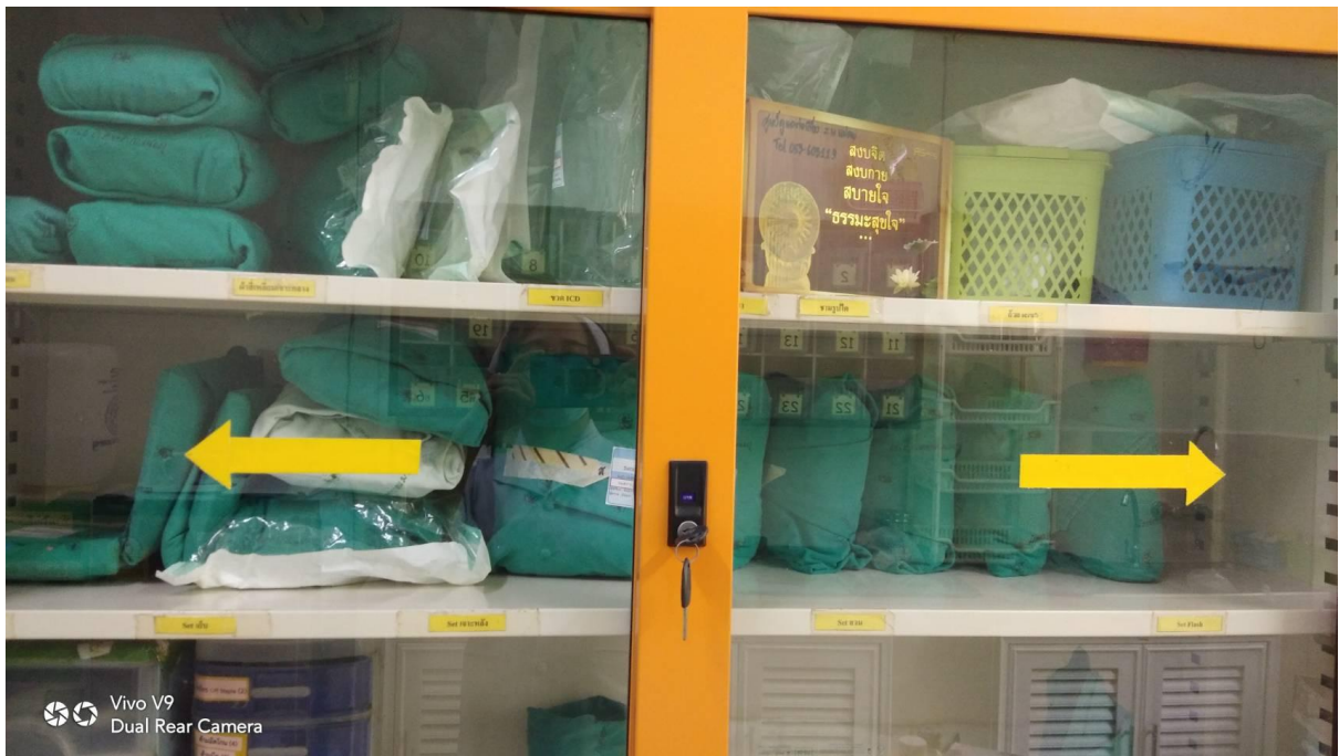
ตู้เก็บเวชภัณฑ์ที่เหมาะสม