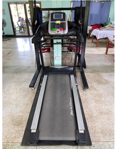
เครื่องมือหรืออุปกรณ์ที่ใช้ในการทำกายภาพบำบัด รวมถึงเครื่องมือไฟฟ้าและอิเล็กทรอนิกส์ตามมาตรฐานการประกอบวิชาชีพ