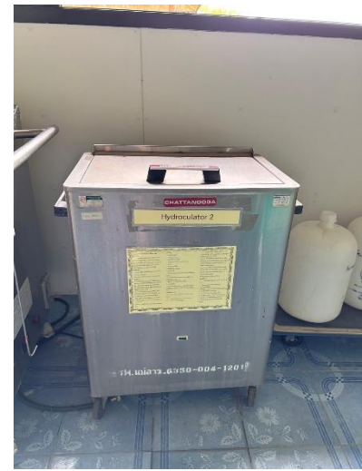
เครื่องมือหรืออุปกรณ์ที่ใช้ในการทำกายภาพบำบัด รวมถึงเครื่องมือไฟฟ้าและอิเล็กทรอนิกส์ตามมาตรฐานการประกอบวิชาชีพ