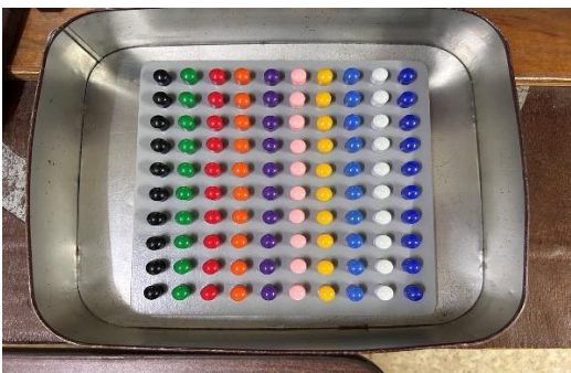
เครื่องมือหรืออุปกรณ์ที่ใช้ในการทำกิจกรรมบำบัด ตามมาตรฐานการประกอบวิชาชีพ