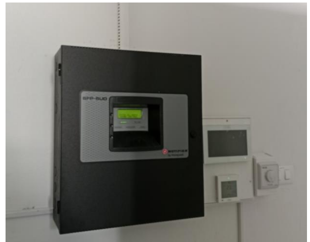
ภาพประกอบ ระบบเตือนภัย ห้อง Server (ใหม่)