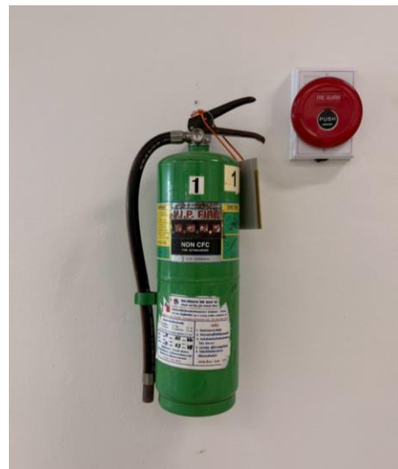
ภาพประกอบ ถังดับเพลิง ห้อง Server (ใหม่)