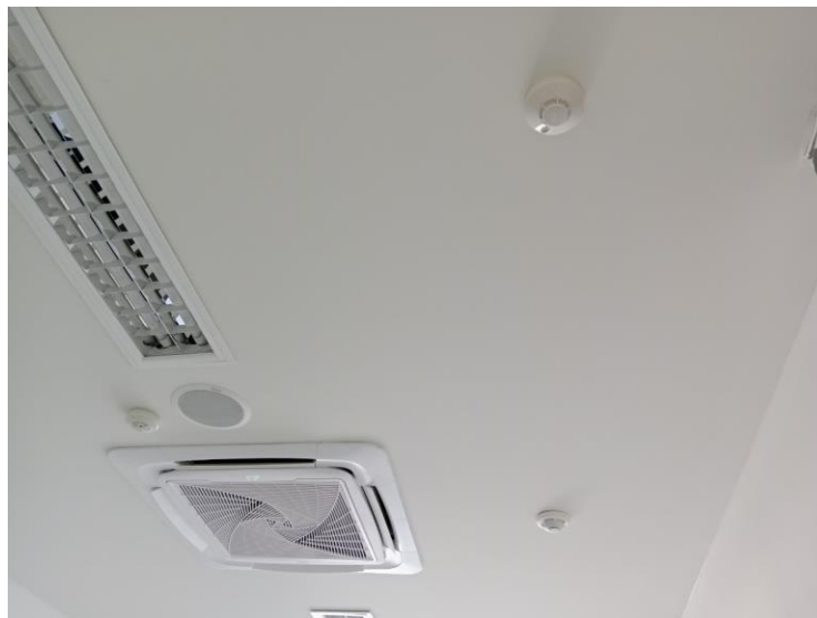
ภาพประกอบ ระบบตรวจจับควันห้อง ห้อง Server (ใหม่)