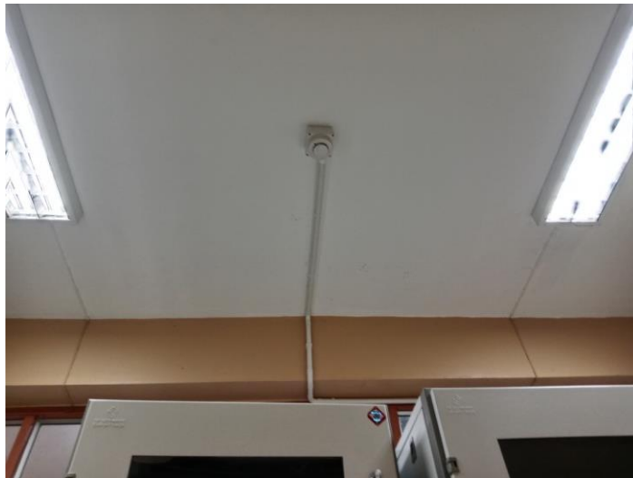
ภาพประกอบ ระบบตรวจจับควันห้อง ห้อง Server (เดิม)

โรงพยาบาลแม่ลาวมีห้อง Server 2 ห้องด้วยกัน 1.ตึก OPD (เดิม) 2.ตึก OPD (ตึกใหม่) ระบบตรวจจับควัน